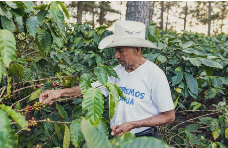
Guatemala, Kaffeebauer in San Juan Emita

Wir übernehmen Mitverantwortung für den entwicklungspolitischen Erfolg. Die Partner vor Ort sind für die Vorbereitung und Umsetzung der Vorhaben verantwortlich. Sie schreiben die Aufträge für Beratung, Lieferungen und Leistungen öffentlich aus und schließen – nach Prüfung durch die KfW – die entsprechenden Verträge. Wenn wir die Unterlagen prüfen, achten wir darauf, dass Ausschreibung und Vergabe fair und transparent nach international anerkannten Regeln verlaufen. Die Vergaberichtlinien sind öffentlich. Bei allen von uns geförderten Vorhaben legen wir Wert darauf, dass von allen Beteiligten hohe internationale Standards in Bezug auf soziale Aspekte, Korruptionsbekämpfung sowie Klima- und Umweltschutz eingehalten werden.